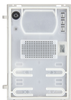
41002 - Unità DueFiliPlus audioteleloop IN video