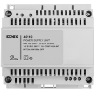
40110 - Alimentatore 2F+ 100-240V 1 OUT 1,6A