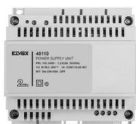
40110 - Alimentatore 2F+ 100-240V 1 OUT 1,6A