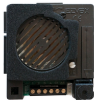
930G - Unità Sound System audio per 4+n