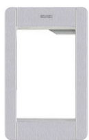
41131.01 - Supporto+cornice 1M Pixel grigio