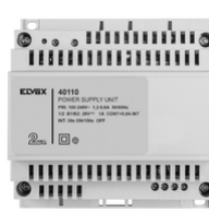
40110 - Alimentatore 2F+ 100-240V 1 OUT 1,6A