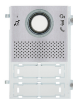
41105.01 - Mod.frontale A/V Pixel Teleloop grigio