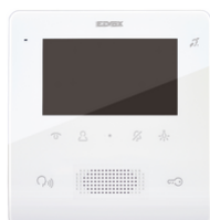
7559 - Videocitofono TabFree4,3 2F+vivav.bianco