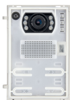
41005 - Unità 2F+ A/V teleloop grandangolo