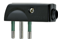
00206 - Spina 2P+T 10A SPA11 90° nero