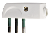
00206.B - Spina 2P+T 10A SPA11 90° bianco