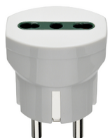
00301.B - Adattatore ted./franc. +P17/11 bianco