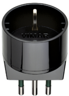
00302 - Adattatore S11 + P30 nero