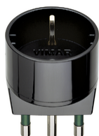
00303 - Adattatore S17 + P30 nero