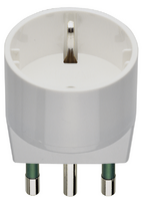
00303.B - Adattatore S17 + P30 bianco