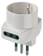
00322.B - Adattatore mult. S11+2P11+P30 bianco