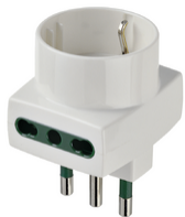
00323.B - Adattatore mult. S17+2P17/11+P30 bianco