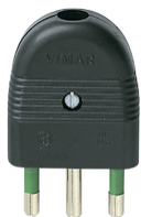
01026 - Spina 2P+T 16A assiale nero