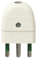
01026.B - Spina 2P+T 16A assiale bianco