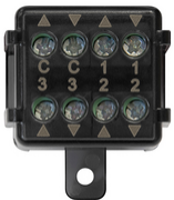
03997 - Modulo centrale Quid tapparelle