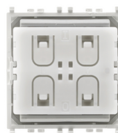
03925 - Comando radio Bluetooth Low Energy