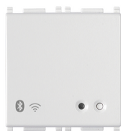
14597 - Gateway connesso IoT 2M bianco