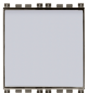
19050.M - Pulsante targhetta 1P NO 10A Metal