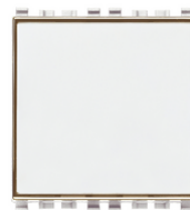
20050.B - Pulsante targhetta 1P NO 10A bianco