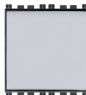
19050 - Pulsante targhetta 1P NO 10A grigio