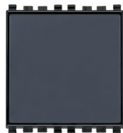
20050 - Pulsante targhetta 1P NO 10A grigio