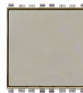
20050.N - Pulsante targhetta 1P NO 10A Next