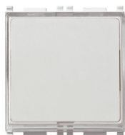
14050 - Pulsante targhetta 1P NO 10A 250V bianco