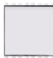
19050.B - Pulsante targhetta 1P NO 10A bianco