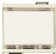
08420 - Pulsante targhetta 1P NO 10A 12-24V