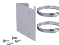
14969 - Staffa fissaggio palo contenitore 14962