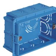
V71303 - Scatola incasso rettang. 3M azzurro