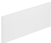
V70110 - Coperchio alta resistenza per V70010