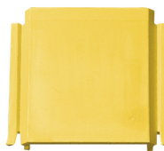
V70191 - Giunto unione per scatola deriv. giallo